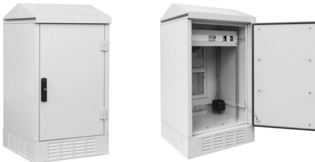
SZK-18U z klimatyzatorem