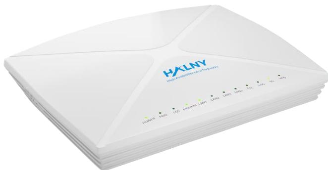
Rys. 1 Panel przedni